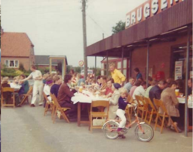
Glimt fra morgenkaffen i byfesten ved Brugsen (1976)