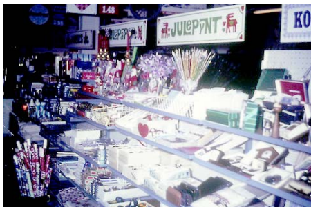
Juleudstilling i 1964 med ideer til julepynt og julegaver i Brugsen.