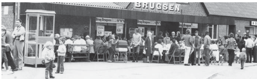
Morgenkaffe ved Brugsen om lørdagen i byfesten fra 1975 - den første byfest i Grejs