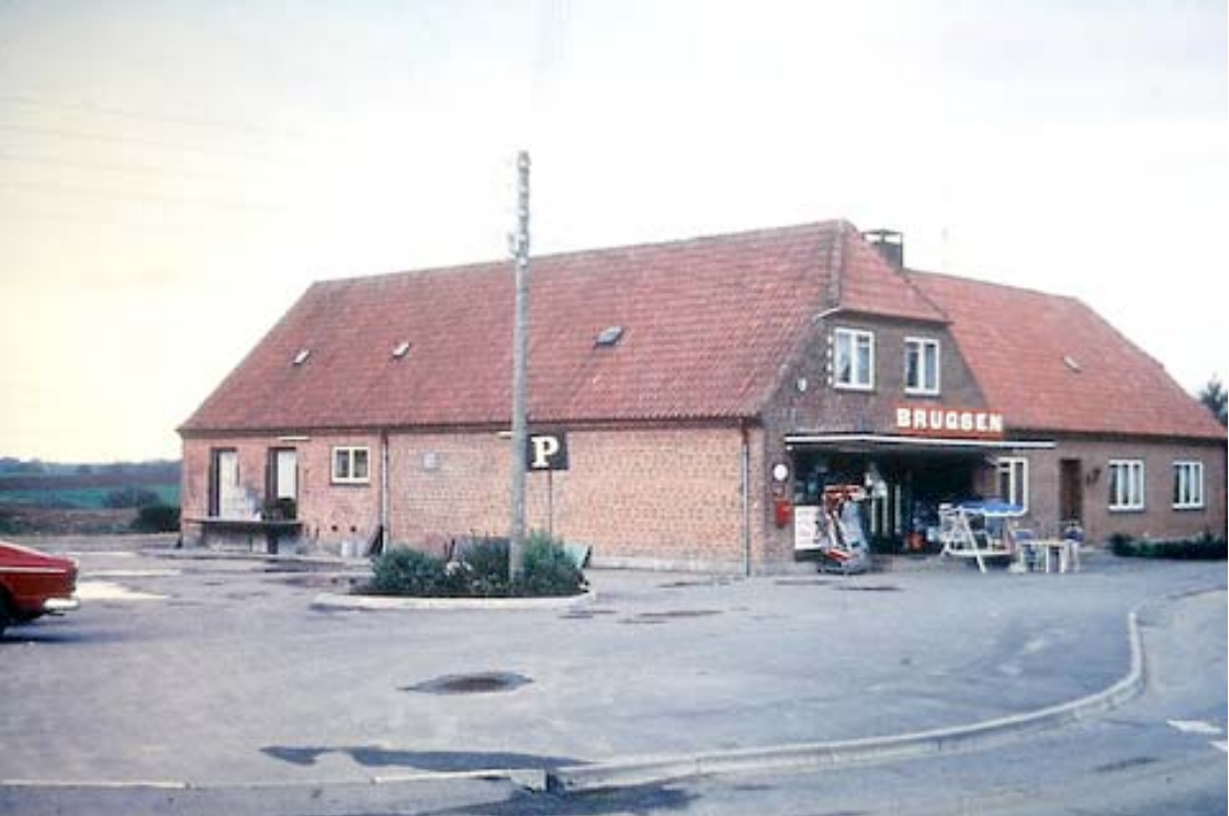
■ Brugsen på Nørre Bygade 7 Grejs, som den så ud i 1969 før tilbygning af butik- men med nyanlagt parkeringsplads.