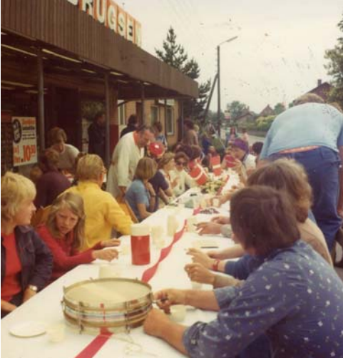
Glimt fra morgenkaffen i byfesten ved Brugsen (1976)