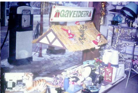
Udstilling af julegave forslag i 1964