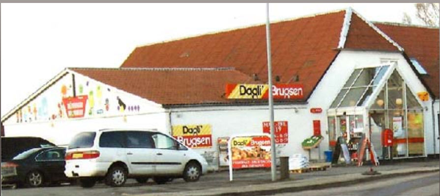
Dagli' Brugsen på Nørre Bygade 7, som huset så ud i 2012

– lokal butik og mødested for borgerne i Grejs