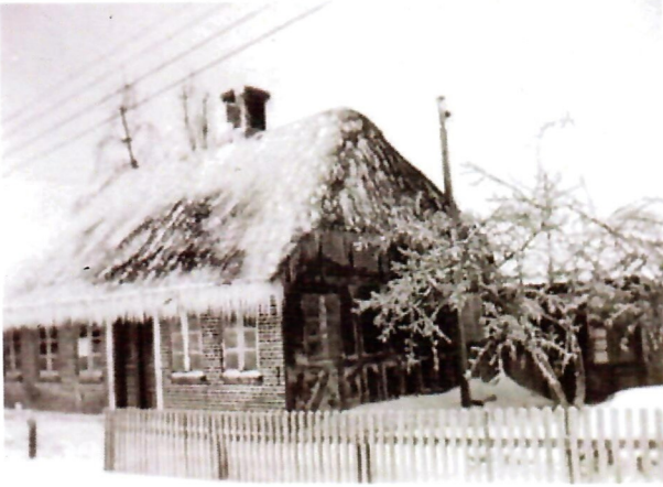
Huset beklædt med istapper, årstal ukendt