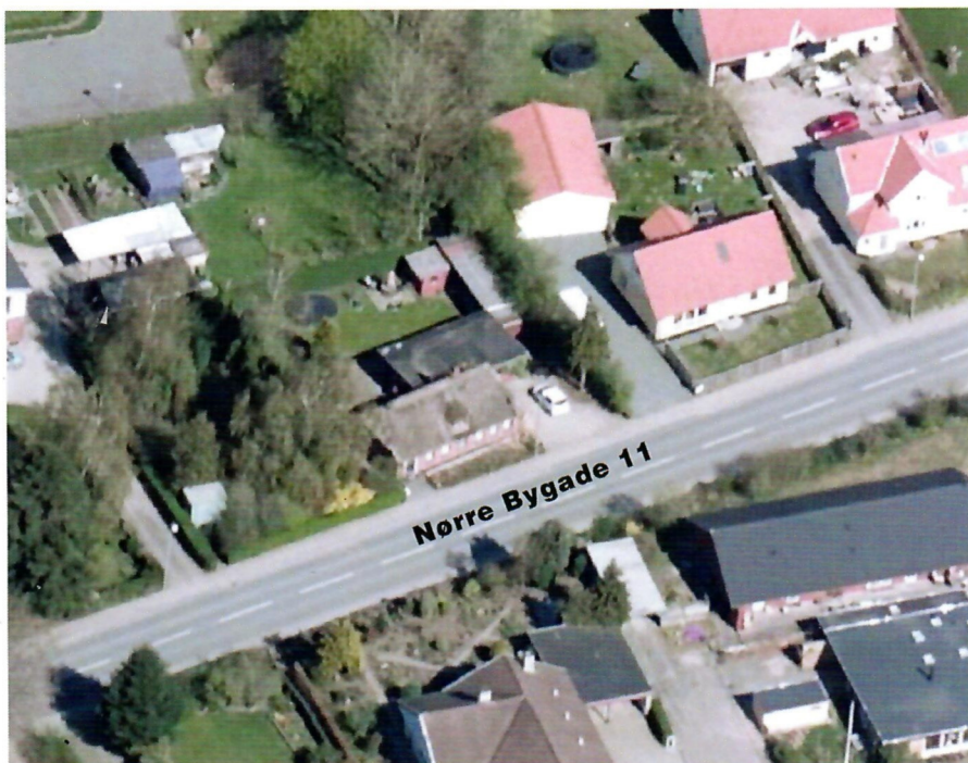
Huset på Nørre Bygade 11 set i et skråfoto fra april 2019, Styrelsen for Dataforsyning.

Alt det kan du læse mere om og få en "tidsrejse" i huset med et forløb over mere end 120 år. Men først nogle billeder af husets beliggenhed i byen og fra forskellige årstider.