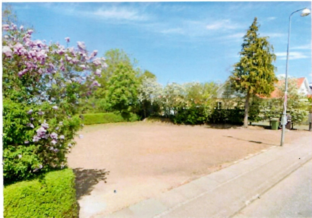
Nu er der bare en grund tilbage og en græsplæne er på vej – Goggle StreetView i 2023.

I dag er der kun grunden med haven og en flot jævnt planeret græsplæne tilbage.