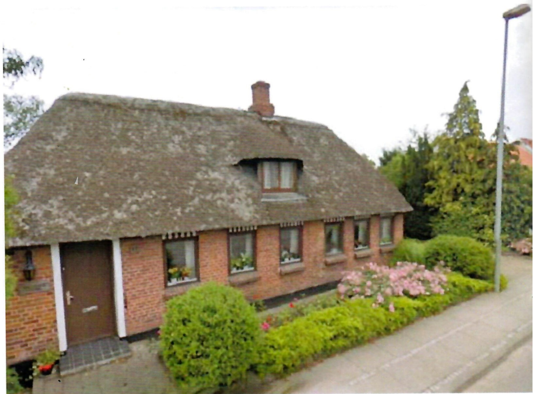
Huset som det så ud i 2010 – udsnit fra Google StreetView