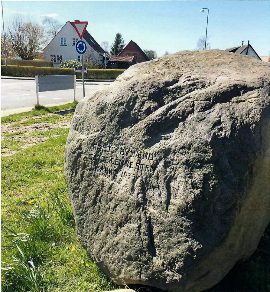
På højre side af stenen ses indskriften: Grejs Bymænd satte denne sten anno 1933

Bymændene fra Grejs solgte gade-jorden til bebyggelse. Her blev bygget det hus, som af Grejsboere er kendt som “ Margrethes Hus ” Grejs Bakke 1. Af pengene fra salget blev der ud over stenprojektet også penge til både kirken, forsamlingshuset samt missionshuset, som lå ved krydset Holtumvej/Højgårdvej. Desuden havde de også forpligtet sig til at holde gadedammen i orden.