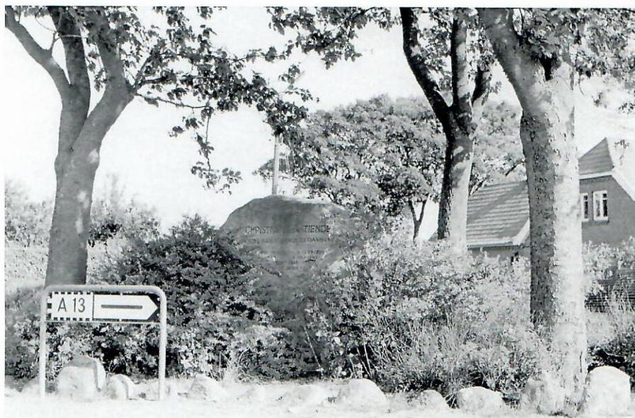
Stenen på sin plads mellem rønnetræerne

Nu kunne man godt få det indtryk, at der må have været en rundkørsel på stedet dengang, men sådan fungerede det nu ikke. Hvis man f.eks. kom fra Holtumsiden og skulle op mod hovedvejen, drejede man bare skarpt til venstre. Man kørte ikke hele vejen rundt.